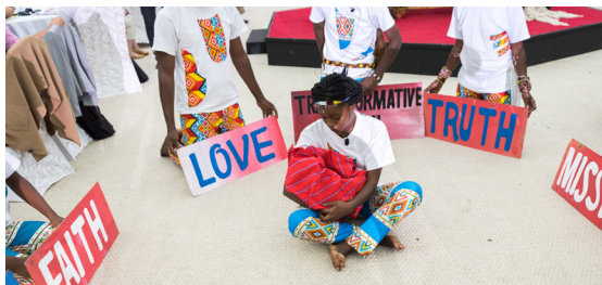
Konferenz für Weltmission und Evangelisation 2018

in einer Welt, in der das tägliche Leben mehr und mehr von Konsumdenken beherrscht und Leistung zunehmend monetär gemessen wird, können Kirchengemeinden ein Ort sein, an dem man sich eine Verschnaufpause gönnen kann: ein Ort der Begegnung, an dem man nichts kaufen oder für etwas bezahlen muss, an dem man nicht danach beurteilt wird, ob man sich etwas leisten kann, an dem niemand ausgeschlossen wird. Eine solche von Respekt und Vertrauen geprägte Atmosphäre kann die Geburtsstätte für alternative Versorgungsformen und Formen der gegenseitigen Unterstützung sein.